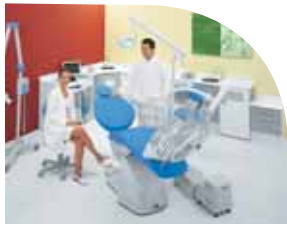
Consegna pezzi di ricambio in 24 ore