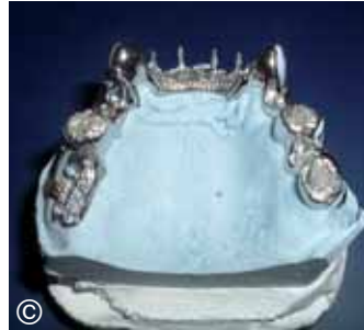
© P.P.R.J.D. Rialzo Articolare Estetico (brevetto)

La Jordan Dental (Lab. Dentale Specializzato in Protesi Scheletrata e Protesi Combinata - Roma-Helsinki - Tecniche/Sistematiche/Materiali di lavorazione Scandinavi - Tecniche Arthur J. Kroll - M. Pezzoli), grazie all'esperienza internazionale acquisita, può oggi proporre agli odontoiatri più attenti alla conservazione dei tessuti parodontali del proprio paziente un'ottima soluzione: la "P.P.R.J.D. PARODONTALE".