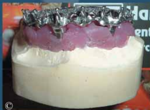
© STRUTTURA MONOBLOCCO INSERITA SU IMPIANTI

JORDAN DENTAL - Via Rainaldo 28 - 00119 ROMA Tel. Lab. +39 06 56350128 Cell. +39 338 2481990 E-mail: jordan.dental@alice.it info@jordandental.it Sito web: www.jordandental.it