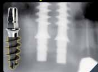
A carico immediato