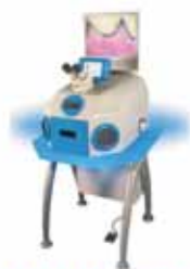
ARKIMEDES LASER DI SALDATURA

Congresos Costa del Sol - C/ Monte de Sancha 8, 29016 Malaga Tel: 952 609 100 Fax: 952 229 613 Email: info@congresoscostadelsol.com Website: www.sedo.es // www.congresoscostadelsol.com - Venue: Palacio de Ferias y Congresos de Malaga, Avda. José Ortega y Gasset 201, 29006 Málaga