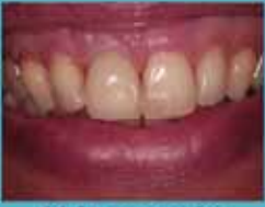
11 in ceramica su impianto