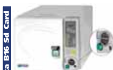
Pretika B16 Ssd Card

Autoclave completamente automatica, due cicli 121° e 134°, asciugatura automatica, carico acqua manuale con beaker, ciclo S, 7 lit.