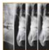
Immagine di sezioni tomografiche

CCD alta definizione + sezioni di stratigrafia + pannello di controllo virtuale e/o reale + 12 programmi d'esame + 18 programmi anatomici + posizionamento paziente face-to-face + Connessione USB2: immagine in tempo reale + Compact Flash: acquisizione senza PC + Tri-motore assiale + estensione Ceph digitale.