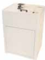
MILLENNIUM FONDITRICE CENTRIFUGA AD INDUZIONE