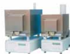
WARMY FORNI DA PRERISCALDO