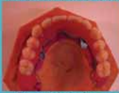
Protesi su barra con chiavistelli

Presenti settimanalmente su Firenze / Arezzo In tutta Italia con corriere espresso