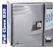
Full Clave B20

Autoclave completamente automatica, undici cicli di sterilizzazione, cicli speciali, vacuum test, asciugatura supplementare, ciclo B frazionato, 16 lit.