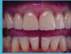
Arcata superiore in ceramica