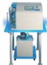
EPHESTOS PRESSOFUSIONE AD INDUZIONE